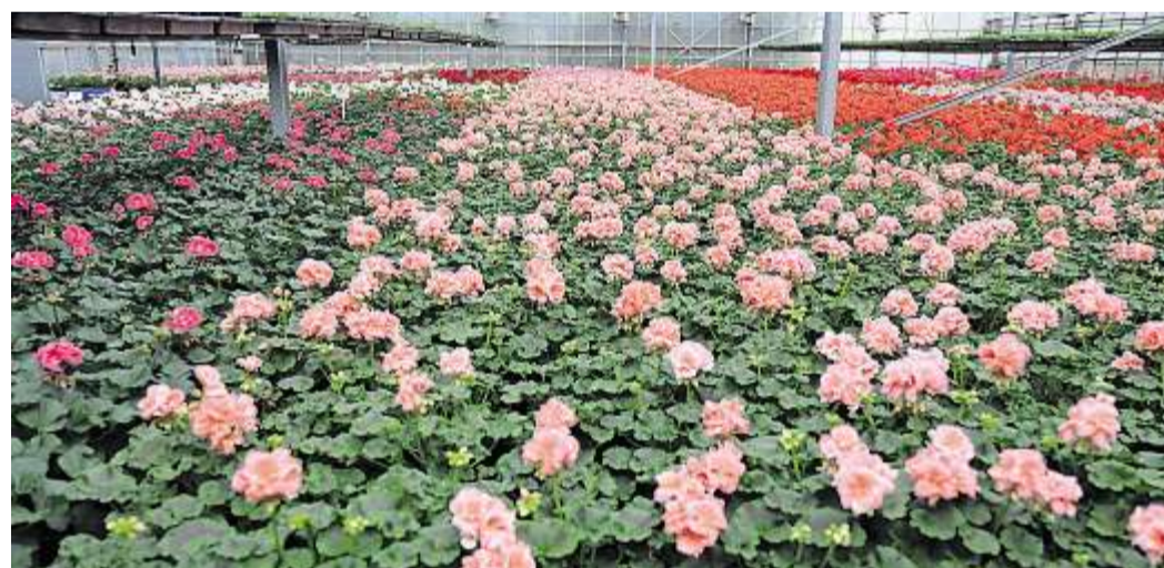
Die Gärtnerei bietet blühende Grüße für alle Anlässe an – von der Blume für den Schwarm bis zu Sträußen für Hochzeit, Geburtstag oder Beerdigung.

Die Kombination einer Gärtnerei mit einem Blumenladen ist darüber hinaus äußerst attraktiv und vielseitig. Denn im Gartenfachbetrieb können die Kunden über alle Themen und zu allen „grünen Fragen“ beraten werden.